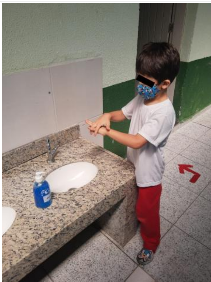
PROTOCOLOS DE SAÚDE