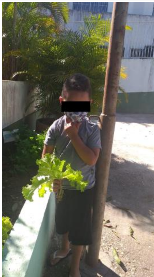
ESPAÇOS REVITALIZADOS HORTA