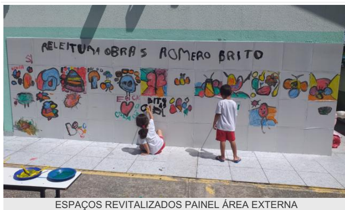
ESPAÇOS REVITALIZADOS PAINEL ÁREA EXTERNA