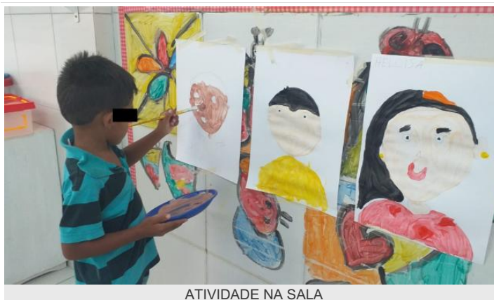
ATIVIDADE NA SALA